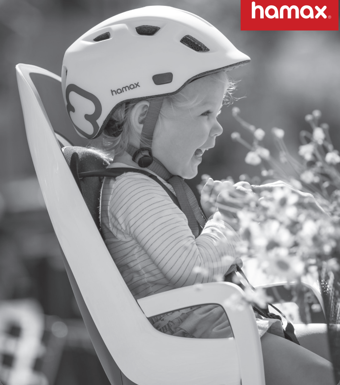
Hamax id: 12204, rev. 003, Safety instructions carrier mounted seats CS

EN Bicycle Child Seat with carrier mounted adapter